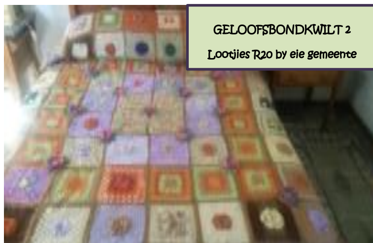
GEOLOFSBONDKWILT 2 Lootjies R20 by eie gemeente